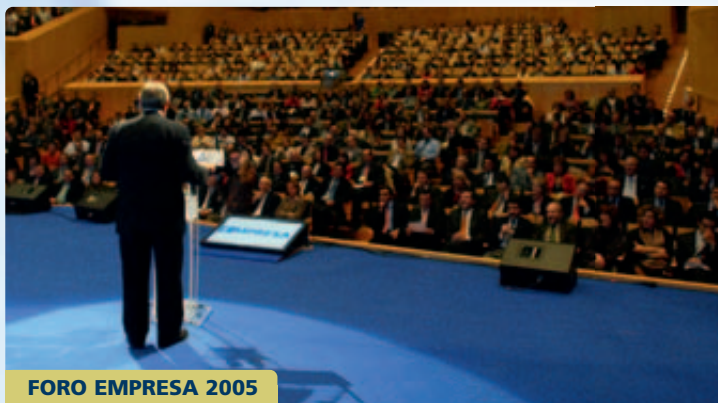
FORO EMPRESA 2005