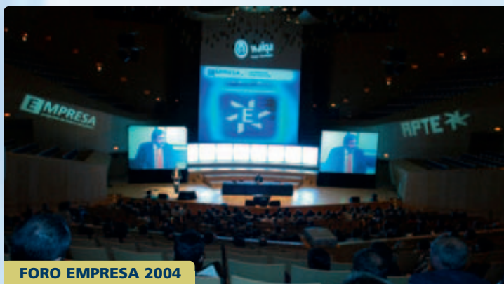
FORO EMPRESA 2004