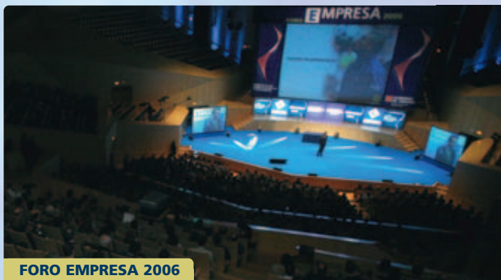
FORO EMPRESA 2006