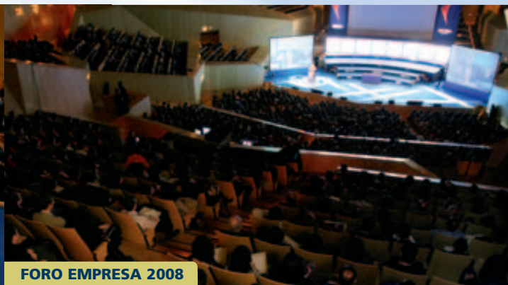
FORO EMPRESA 2008