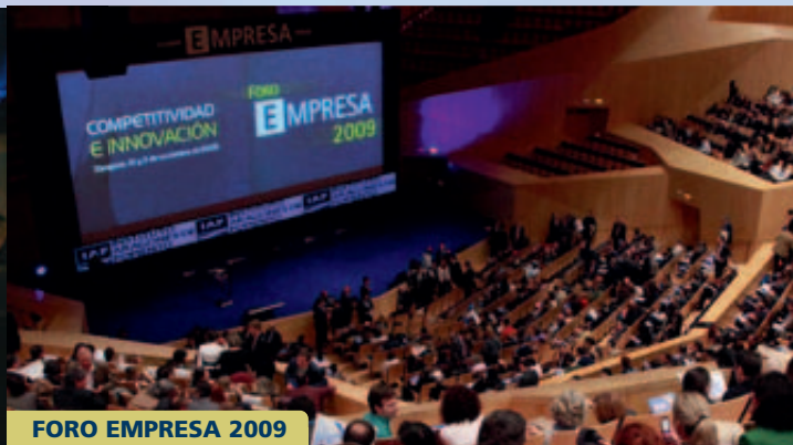
FORO EMPRESA 2009