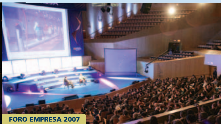
FORO EMPRESA 2007