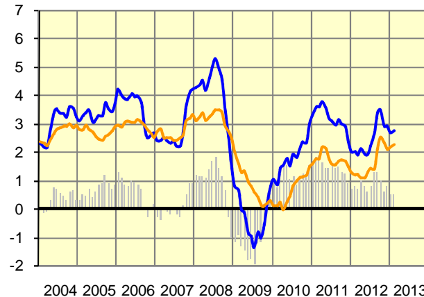
Inflación general y subyacente (España) (Variación anual en %)

— Diferencial gral-subyac — General — Subyacente