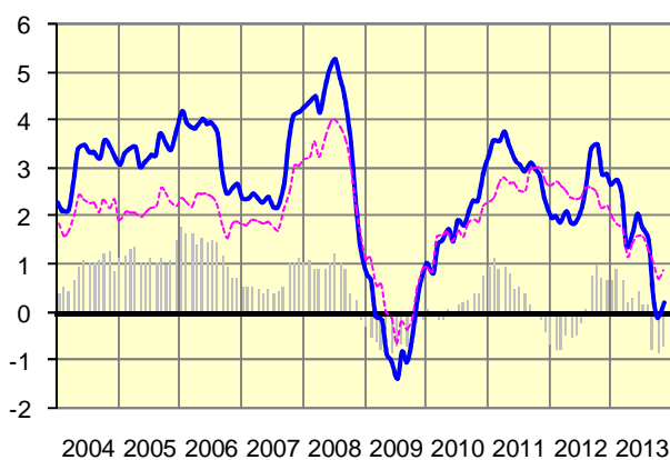
Evolución Precios de Consumo España - UEM (Variación anual en %)