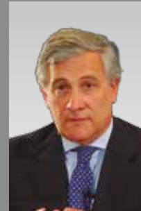
Antonio Tajani Vicepresidente de la Comisión Europea y Comisario de Industria y Emprendimiento