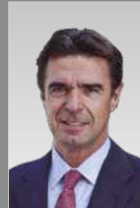
José Manuel Soria Ministro de Industria, Energía y Turismo del Gobierno de España