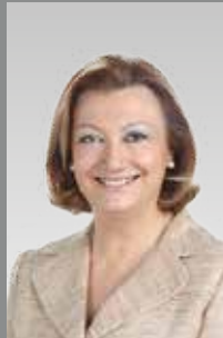
Luisa Fernanda Rudi Presidenta del Gobierno de Aragón