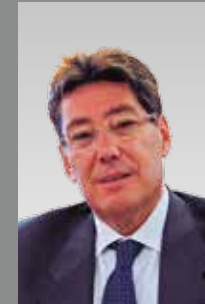
Arturo Aliaga Consejero de Industria e Innovación del Gobierno de Aragón