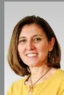
Begoña Cristeto Secretaría General de Industria y de la Pyme del Ministerio de Industria Energía y Turismo