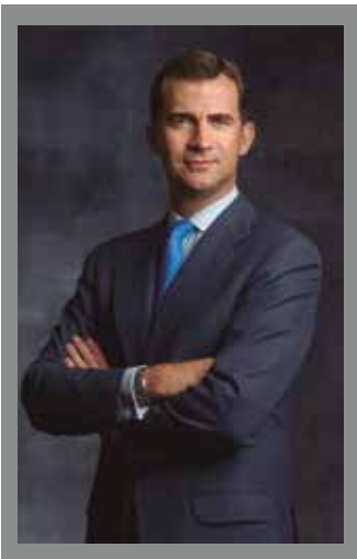
INTERVENCIÓN DE HONOR S.A.R. EL PRINCIPE DE ASTURIAS

FORO EUROPEO DE INDUSTRIA Y EMPRENDIMIENTO EUROPEAN FORUM FOR INDUSTRY AND ENTREPRENEURSHIP FORUM DE L'INDUSTRIE ET DE L'ENTREPRENEURIAT EUROPÄISCHES FORUM FÜR INDUSTRIE UND UNTERNEHMERTUM FORO EUROPEO DELL'INDUSTRIA E L'IMPRENDITORIA