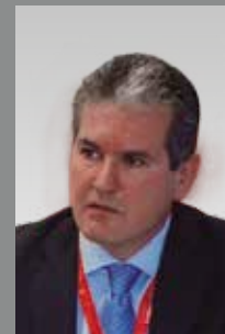
Iñigo Urresti Unidad de Política estratégica de la Dirección General de Empresa e Industria de la Comisión Europea