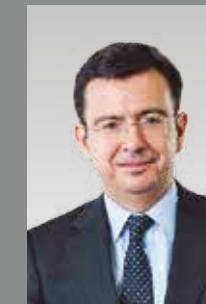
Román Escolano Presidente del Instituto de Crédito Oficial (ICO)