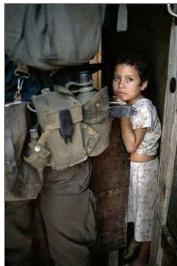
Niña desplazada El Salvador. Marzo 1989