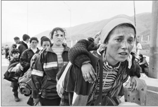
Mujeres en paso fronterizo Kosovo. Abril 1999