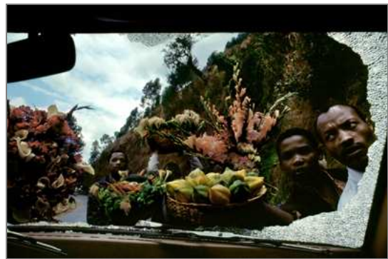
Vendedores de fruta Burundi, África. Septiembre 1994