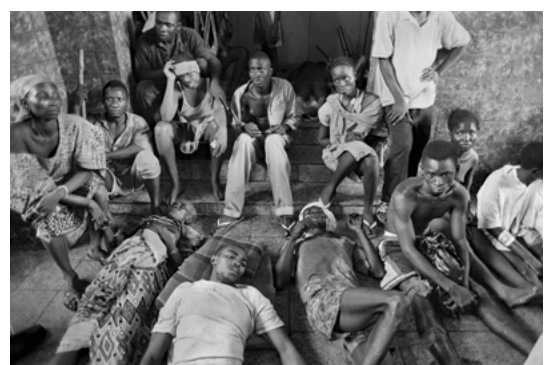
Heridos por bombardeos Sierra Leona, África. Enero 1999