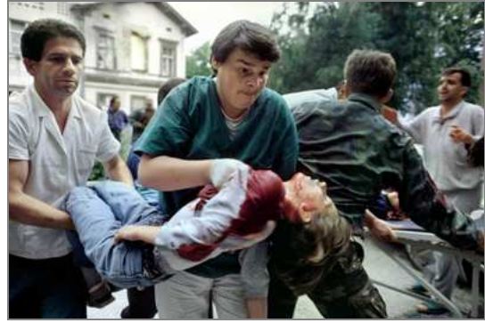
Traslado de una niña moribunda Bosnia-Herzegovina. Guerra de los Balcanes. Oct. 1993