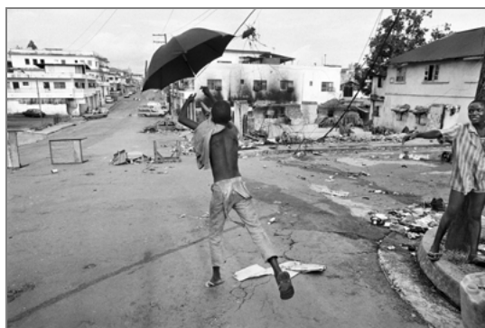
Jugando con paraguas Monrovia (Liberia). Mayo 1996