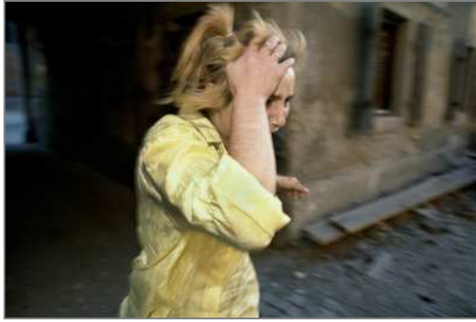
Mujer huyendo Croacia. Guerra de los Balcanes. Oct. 1991