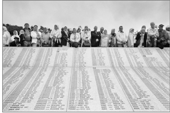
Memorial Srebrenica Bosnia-Herzegovina. Julio 2005