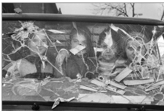
Niñas tras el cristal de un coche. Bosnia. Guerra de los Balcanes. Mar. 1994