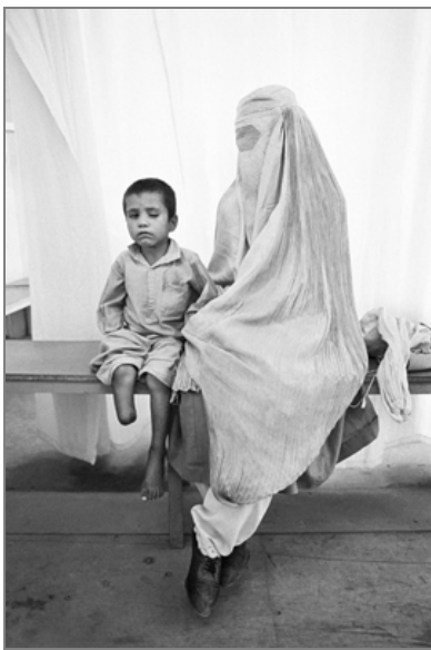
Niño mutilado y madre con burka Afganistán. Agosto 1996