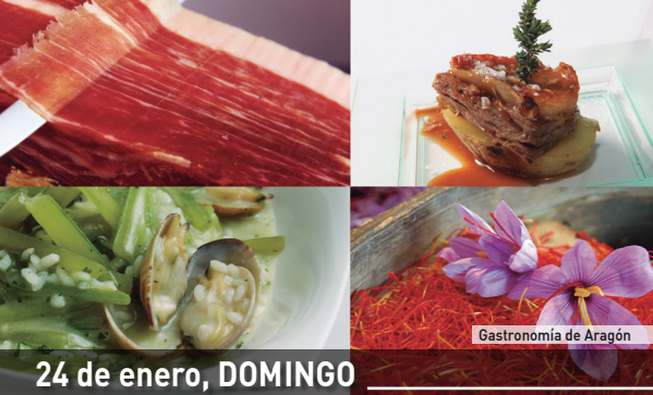
Gastronomía de Aragón