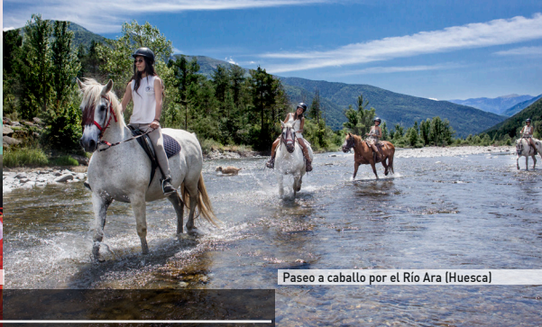
Paseo a caballo por el Río Ara (Huesca)