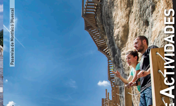
Pasarelas de Montfalcó (Huesca)