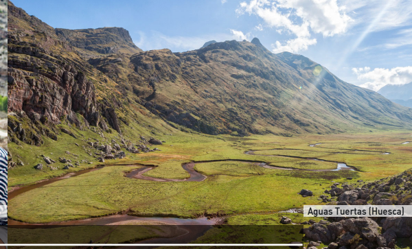
Aguas Tuestas (Huesca)