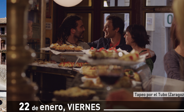
Tapero por el Tubo (Zaragoza)