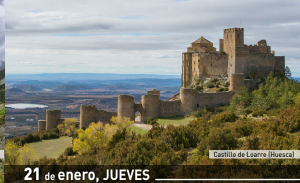
Castillo de Loarre (Huesca)