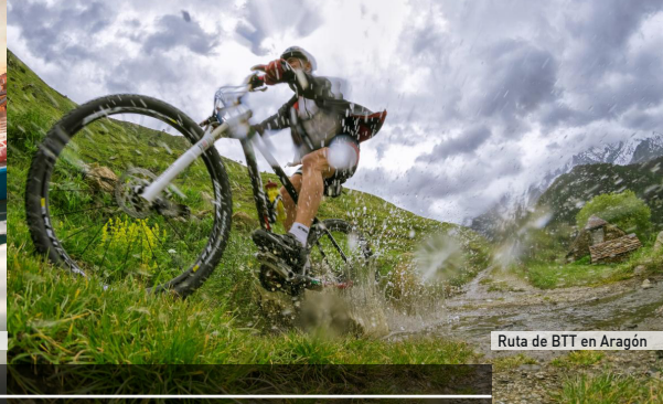
Ruta de BTT en Aragón