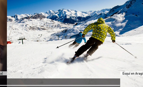
Esquí en Aragón