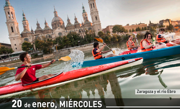
Zaragoza y el río Ebro